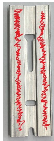
ilustrační foto nanesení lepidla na zadní desku